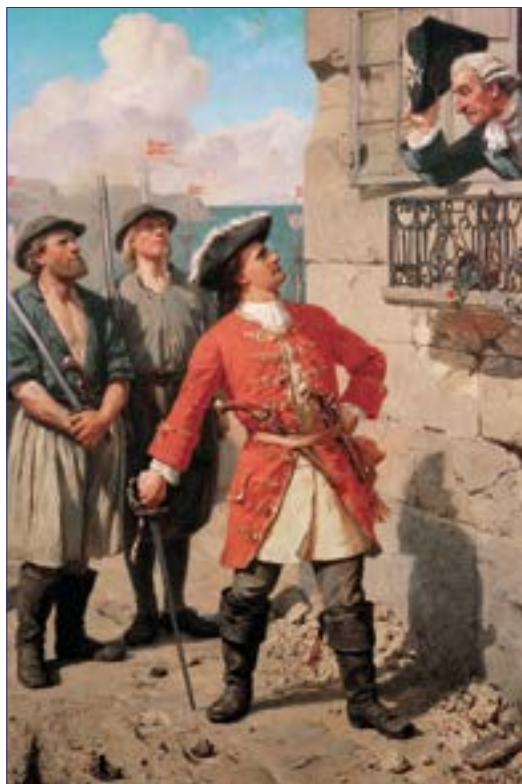
Maleri af Otto Bache – tilhørende Fyns Kunstmuseum.

Det er de færreste danskere og nordmænd, som ikke kender til Tordenskiold. Den gamle skillingsvise, tændstikæskerne og ikke mindst det, at han kunne slå svenskerne gang på gang, har gjort sit til at fasttømre mindet om alle tiders søhelt i danskeres og nordmænds bevidsthed.