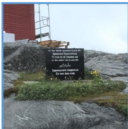
Mindestenen i Nuuk.

Efter Gudstjenesten vil der være en kort reception i kirken