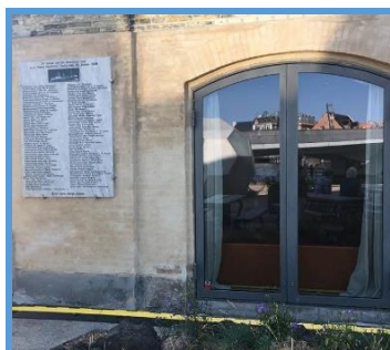
Mindestenen ved Nordatlantens Brygge.